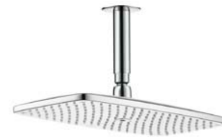
Основной душ Hansgrohe Raindance, черная отделка