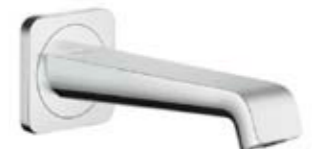
Носик для смесителя в ванной Axor Citterio E, черная отделка