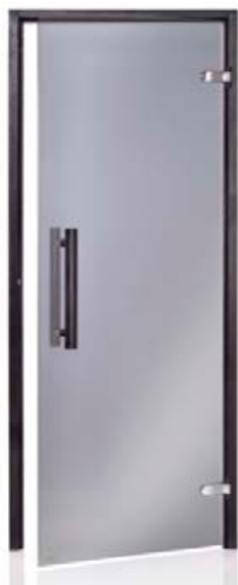
Дверь сауны Horizon