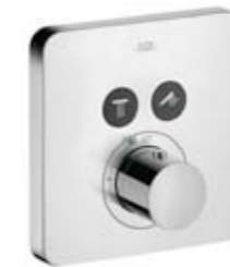
Термостатический смеситель Axor ShowerSelect, черная отделка