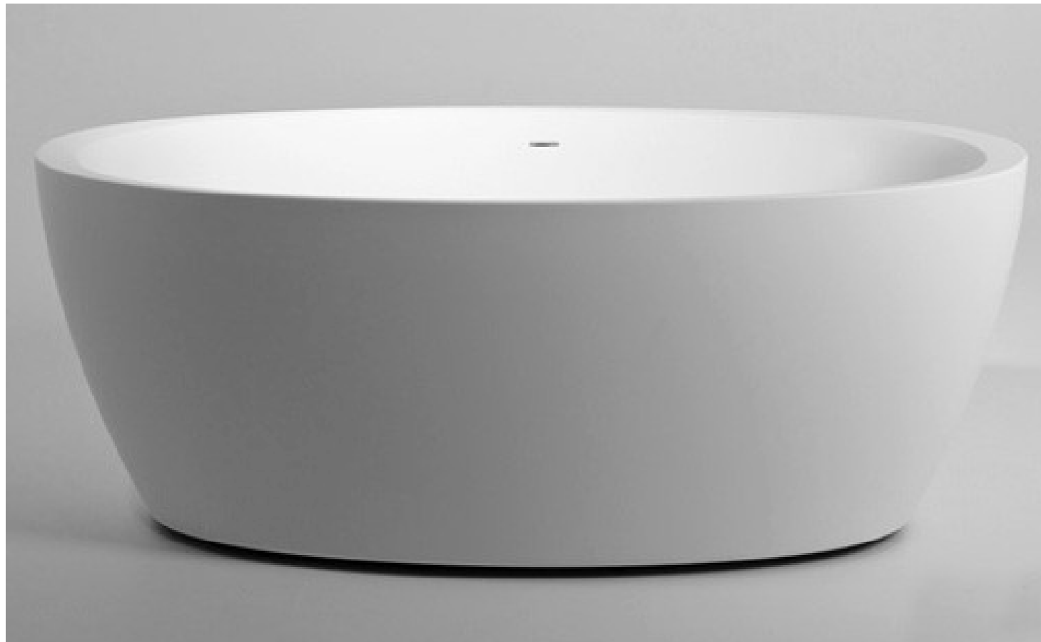
Каменная ванна Balteco Senzo