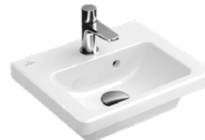
Раковина в ванной Villeroy & Boch Subway 2.0