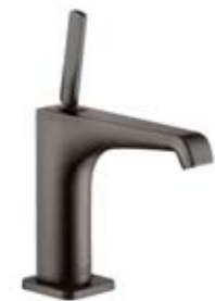
Смеситель Axor Citterio E