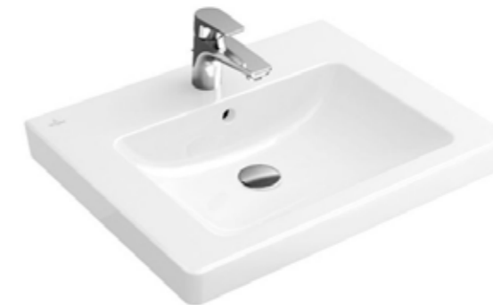
Раковина в туалете Villeroy & Boch Subway 2.0