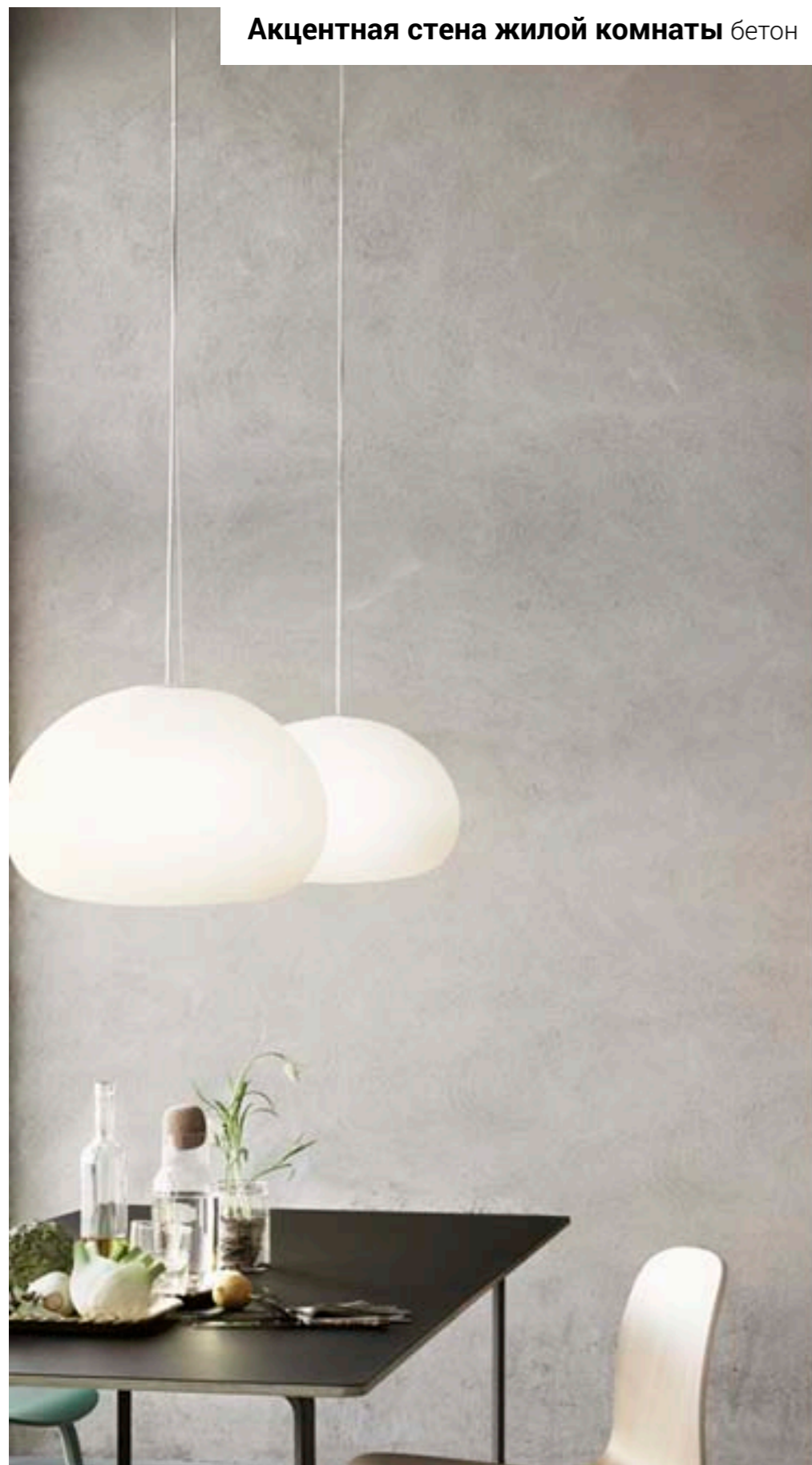
Акцентная стена жилой комнаты бетон