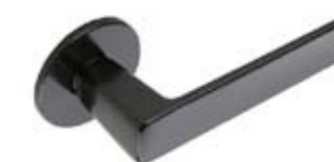
Внутренние дверные ручки Abloy Polar