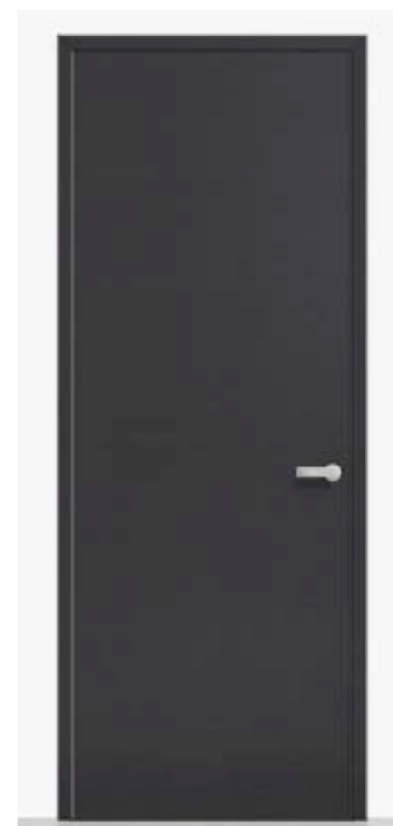
Внутренняя дверь Двери от пола до потолка отделаны черным дубовым шпоном

Графический. Уютный. Контрастный. Для лофта характерна определенный кураж и своеобразие. На внутренних стенах смело использован контраст черного и белого и на полу можно видеть благородный и солидный промасленный паркет. В ваннных комнатах использованы напоминающие бетон керамические плитки, которые поддерживает оттенок окрашенных в белый цвет стен. Черные элементы интерьера сочетаются с натуральным деревом.