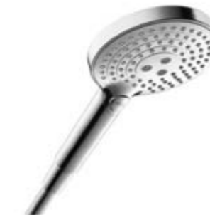
Ручной душ Axor ShowerSolutions, черная отделка