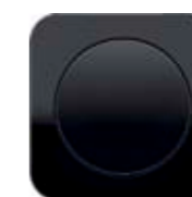
Выключатель Berker серия R