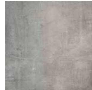
Плитка в ванной и прихожей Porcelaingres Grey