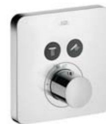
Termostaatti Axor ShowerSelect, musta