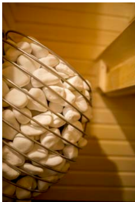
Kiuas Huum Drop