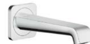
Pesuallashana Axor Citterio E, musta