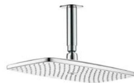
Yläsuihku Hansgrohe Raindance, musta