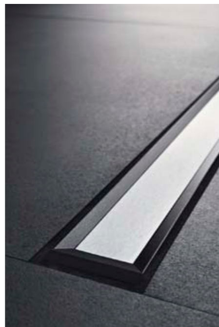
Suihkukouru Geberit Cleanline