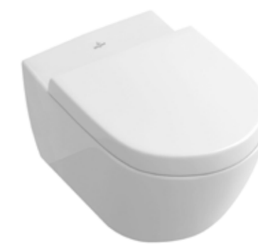
WC-istuin Villeroy & Boch Subway 2.0