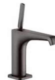
Sekoitushana Axor Citterio E